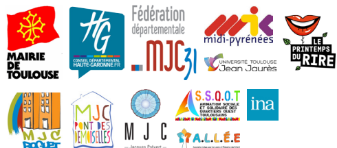
N°SIRET : 32 95 32 70 90 0030 *NE PAS JETER SUR LA VOIE PUBLIQUE*